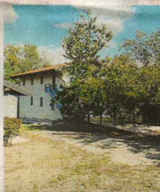
IL LUOGO Il Maglietto

«Il Maglietto dispone di grandi spazi verdi all'esterno e sia-